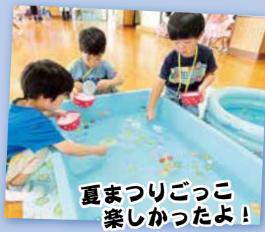
夏まつりごっこ 楽しかったよ！