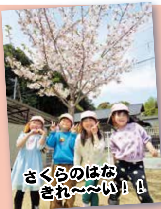
さくらの花はな きれ〜い！！