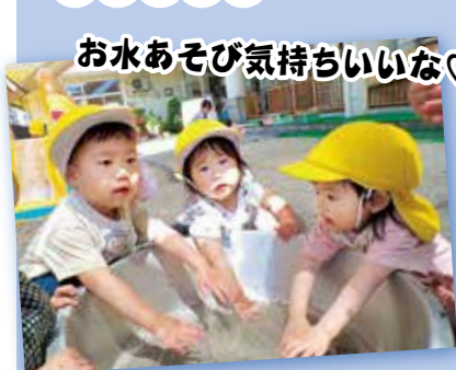
お水あそび気持ちいいな♡