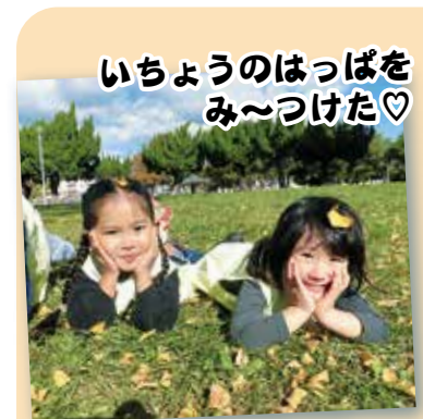
いちちょうのはっぱを み〜つけた♡