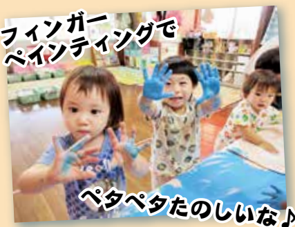
フィンガー ペインティングで