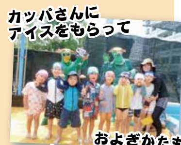
カッパさんに アイスもらって