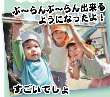
ぶ〜らんぶ〜らん出来る ようになったよ！