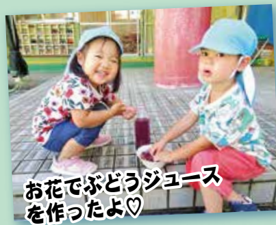
お花でぶどうジュース を作ったよ♡